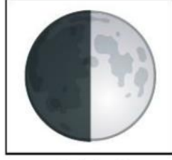
Şekil - 2

Yukarıda ayın iki ana evresi verilmiştir. bu iki ana evrenin isimlerini yazarak iki ana evre arasındaki süresi kaç haftadır.(10 PUAN)