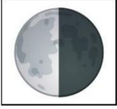
Şekil - 1